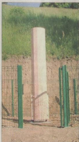
Un dernier regard dans la cheminée avant la mise en service de la ruche Bee-pass.