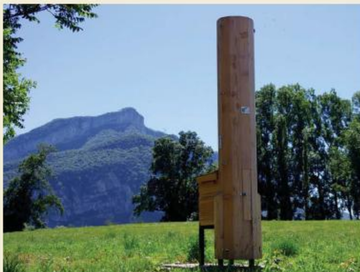
Exemple d'une ruche pédagogique dans le Vercors

L'endroit se prête bien par ailleurs à des sorties scolaires avec beaucoup d'espaces dédiés à la promenade.